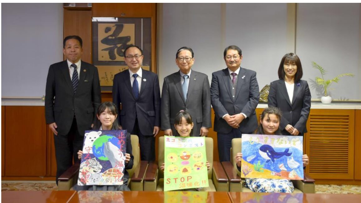
受賞した児童・生徒との記念撮影

本活動が環境について考えるきっかけとなり、エコ活動が広がっていくことを期待しています。